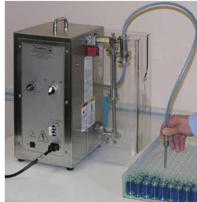
Series AB Máquinas para Trabajos Medianos