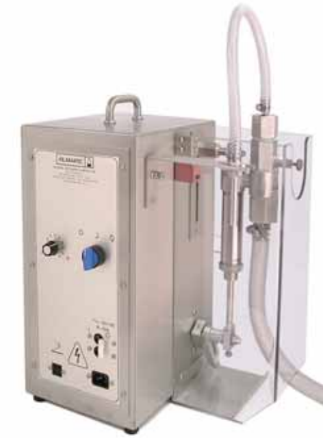
Series AB Portátil De Servicio Mediano Una sola Bomba Llenados hasta de 260 mL