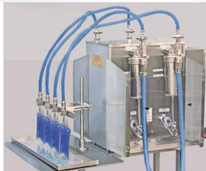
Series DAB Máquinas Portátiles de Alta Precisión

Filamatic ofrece las pruebas de los productos GRATIS para determinar la solución de llenado más apropiada para usted. Proporcionamos la mejor opción en la adquisición mas adecuada para su presupuesto, incluyendo arriendos y contratos de arrendamientos. Nosotros inclusive, tenemos un programa donde estipulamos lo siguiente: "Pruebe su Producto Antes de Comprarlos" para asegurarnos su satisfacción completa.